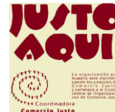
LOGOTIPO DE TIENDAS